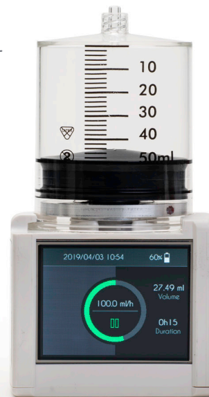
73 83 16 SO♥FILL 50ml 32st/frp