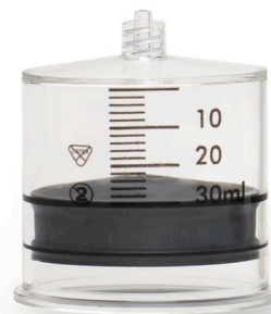
73 83 15 SO♥FILL 30ml 32st/frp