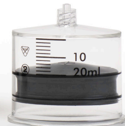
73 83 14 SO♥FILL 20ml 32st/frp